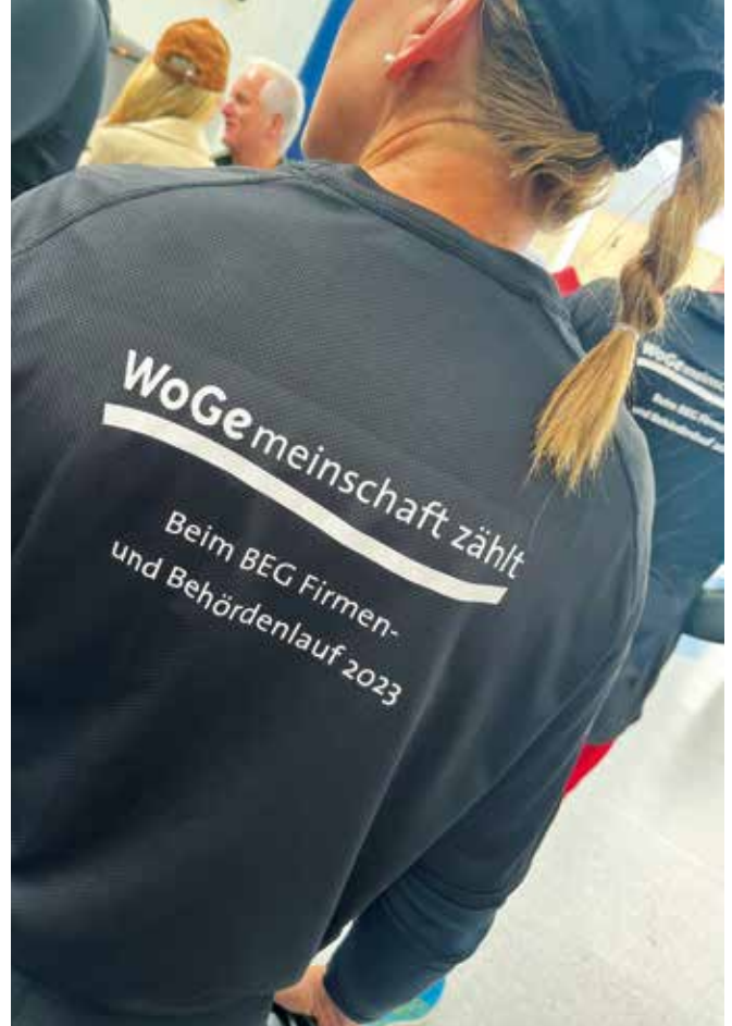
WoGemeinschaft zählt! Jeder ist herzlich willkommen!

Die Kosten für die Teilnahmegebühr und für entsprechende T-Shirts, die unsere Teamzugehörigkeit erkennen lassen, übernimmt die WoGe. Die T-Shirts dürfen die Teilnehmenden nach erfolgtem Lauf natürlich als Erinnerung behalten.