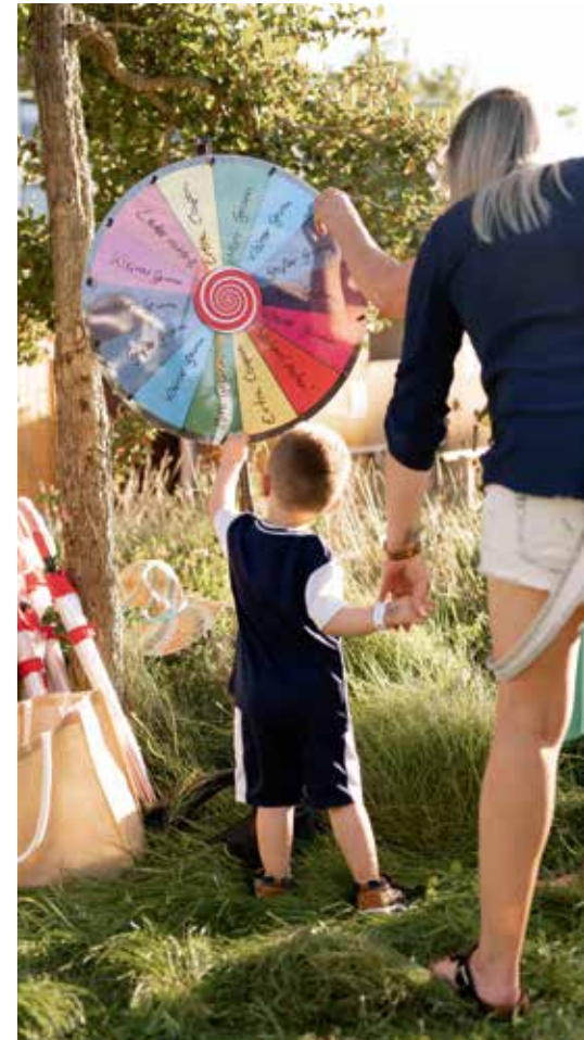
Das WoGe-Glücksrad beim Sommerfest im Beet.