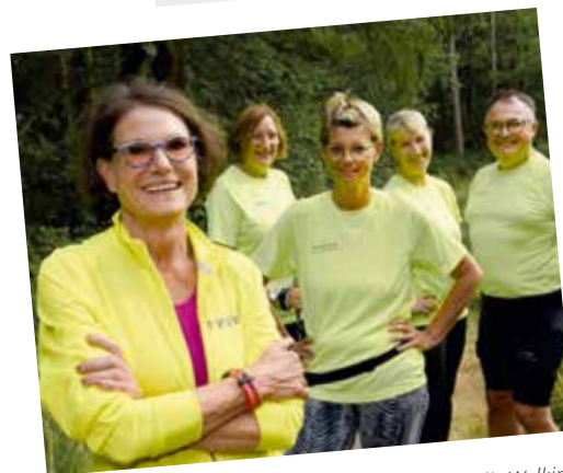
Laufen, Walken und Nordic Walking auf Seite 9

Diakonie-Lieblingsrezepte | Wir sind für Sie da | Impressum