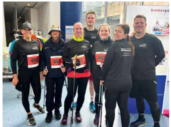
Unser Team beim Firmenlauf 2023

WO? Start und Ziel in den Havenwelten Bremerhaven Wir freuen uns auf einen gemeinsamen Lauf!