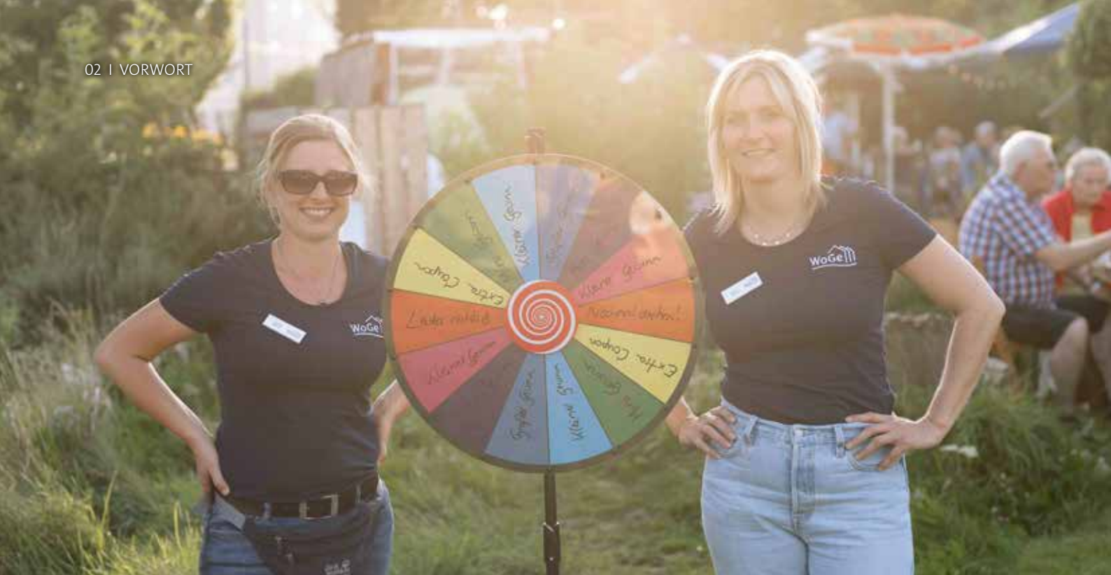
Alle zwei Jahre wieder: Das Sommerfest für Mitglieder der WoGe!