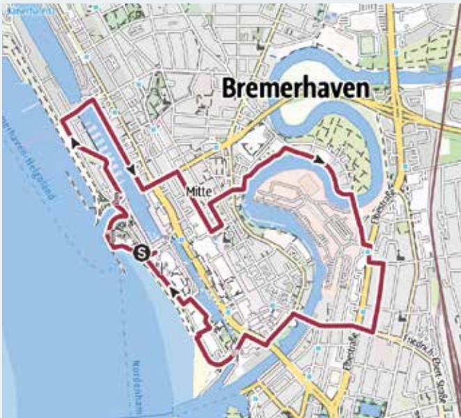
Wanderweg "Marinestadt Bremerhaven"