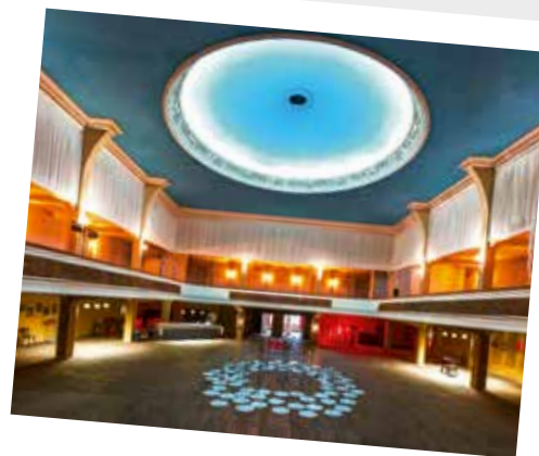
Ein Ort mit Geschichte – Tivoli Bremerhaven auf Seite 18 bis 19