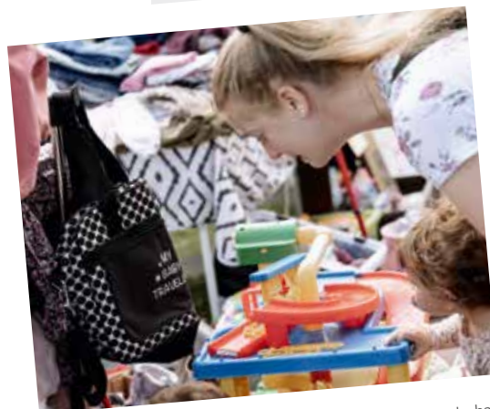
Trödel hier, Trödel da, Trödel ist ganz wunderbar! auf Seite 20