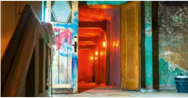
Die Führung findet am 10.05.2025 um 16:00 Uhr statt.